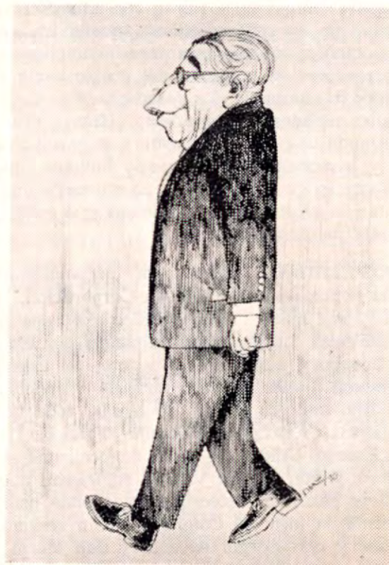
Está en España gozando fulgores

el valor de nuestros músicos y compositores de música criolla. Pero la verdad es que no deben ser tan malos cuando su música se toca con frecuencia. Digamos, "El Punto", "Amor de temporada", "Pasión", "Espíritu guanacasteco", "Los amores de Laco",